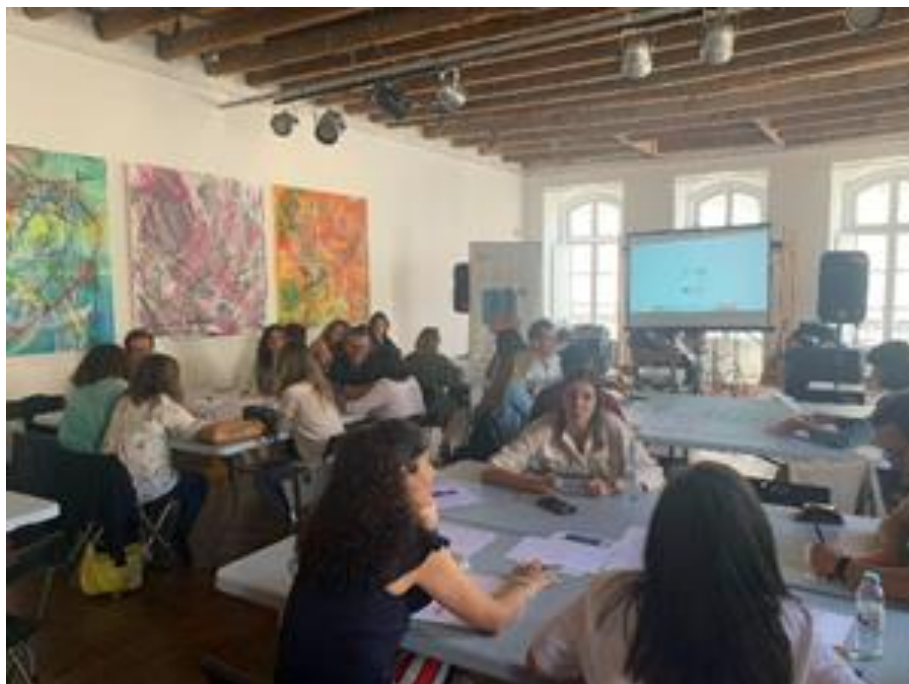
Figura 1.3. Workshop# 3 com técnicos municipais dos Municípios de Palmela, Setúbal e Sesimbra. Sede do Clube Sesimbrense, Sesimbra, 11/maio/2022

Deste workshop resultou a construção colaborativa de 17 ações de adaptação: 4 por setor trabalhado, à exceção do setor Ordenamento do Território, que obteve 5 medidas/ações de adaptação.