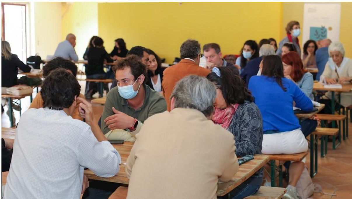
Figura 1.4. Workshop#4, com agentes locais, técnicos de autoridades locais de proteção e segurança e técnicos municipais dos Municípios de Palmela, Setúbal e Sesimbra. Convento de São Domingos, Azeitão, 30/maio/2022

colaborativamente, ações de adaptação climática do respetivo setor, podendo os participantes rodar por mais 3 mesas à sua escolha, contribuindo assim para a construção de ações referentes a 4 setores.