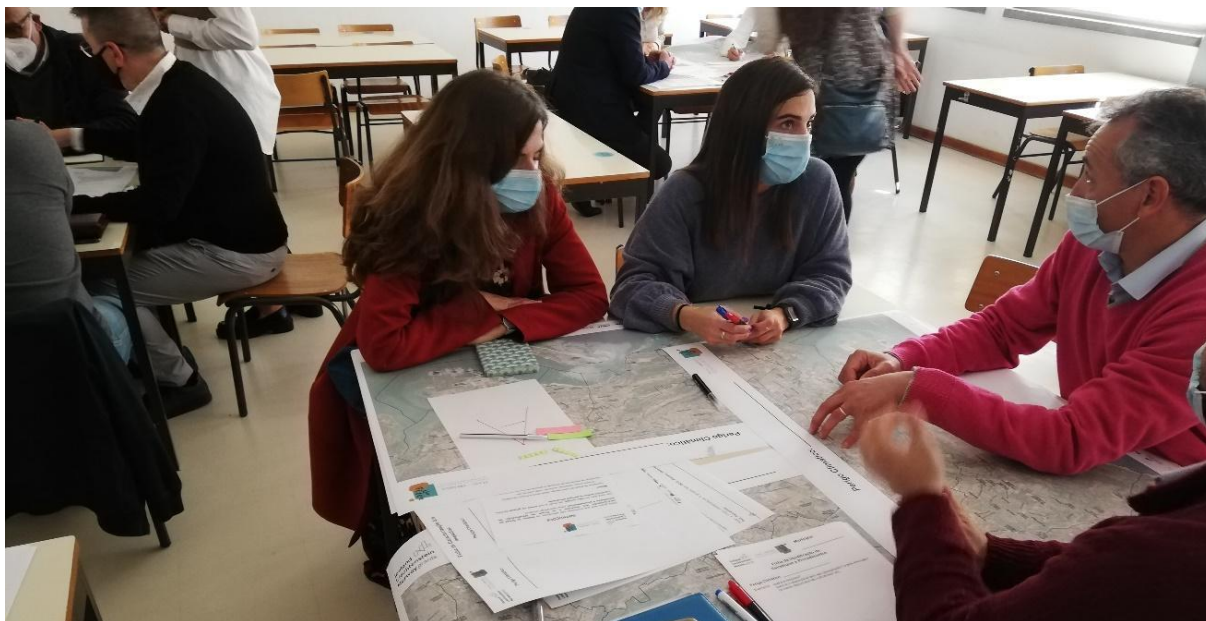
Figura 1.1. Workshop#1 com técnicos de autoridades locais de proteção e segurança e técnicos municipais do Município de Setúbal. Instituto Politécnico de Setúbal, 23/fevereiro/2022

Tal como expresso no Relatório do Workshop#1, redigido pela FCT-NOVA, os 9 participantes do Município de Setúbal construíram a seguinte Visão Estratégica: