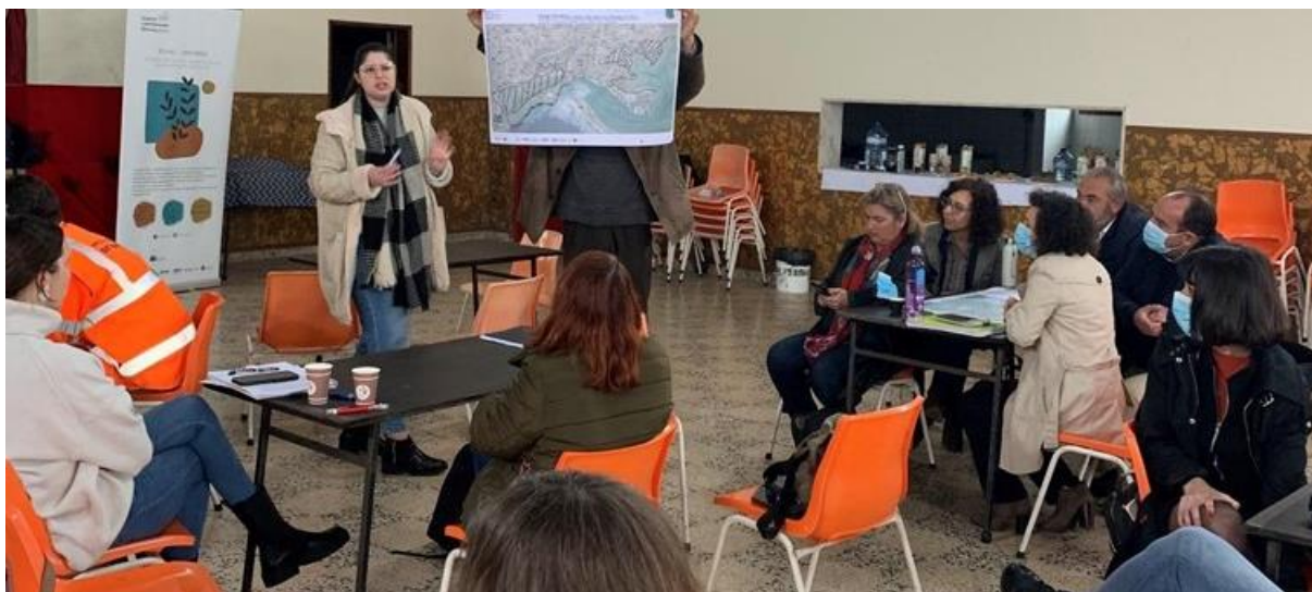
Figura 1.2. Workshop#2 com agentes locais, técnicos de autoridades locais de proteção e segurança e técnicos municipais do Município de Setúbal. Instalações do Rancho Folclórico das Praias do Sado, 22/abril/2022

O Workshop#2 do Programa de Capacitação do PLAAC – Arrábida ocorreu durante o mês de abril de 2022, tendo sido dividido em três sessões, uma para cada município. Em Setúbal realizou-se no dia 22 de abril de 2022, nas instalações do Rancho Folclórico das Praias do Sado.